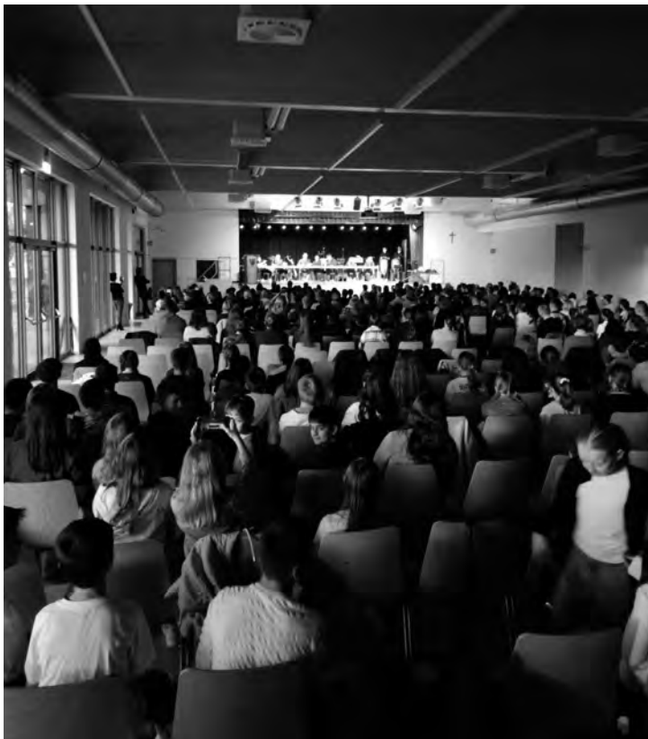
Voll besetztes Haus und große Unterhaltung beim Kulturabend der Realschule Durmersheim

Bestens bewirtet von unserem Elternbeirat und Förderverein konnten sich die Besucher an diesem Abend mit allen Sinnen auf den Frühling einstimmen. Und so waren sich letzten Endes alle einig: Wir freuen uns aufs nächste Jahr!