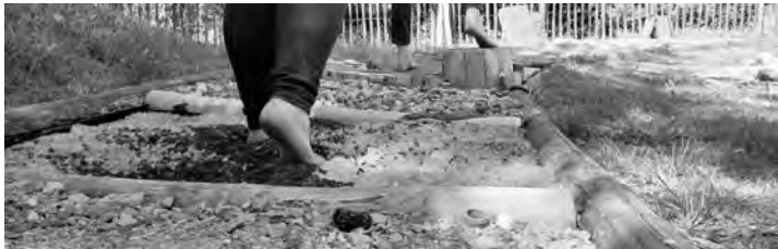
Auf dem Barfußpfad können Kinder verschiedene Stoffarten fühlen.

Zum Saisonstart öffnet der Abfallwirtschaftsbetrieb (AWB) des Landkreises Rastatt am Sonntag, 5. Mai, die Türen seiner Umweltbildungsstation auf dem Gelände der Entsorgungsanlage „Hintere Dollert“ in Gaggenau-Oberweier. An diesem Erlebnistag lädt der AWB pädagogische Fachkräfte, Eltern und Kinder dazu ein, unterschiedliche Stationen rund um die Thematik Abfallvermeidung, Abfalltrennung und Ressourcenschonung auf der Umweltstation zu erkunden. Eltern, Lehrkräfte und Erzieher haben die Möglichkeit, sich vor Ort ein Bild von der Umweltbildungsstation zu machen und Informationen rund um die pädagogischen Angebote zu erhalten. Kinder und Schüler können die verschiedenen Stationen ausprobieren und sich dabei neues „Müll-Wissen“ aneignen. Beispielsweise können sie auf dem Barfußpfad verschiedene Stoffarten hautnah erleben oder die Verrottungs- und Zersetzungsprozesse auf dem Müllfriedhof anschaulich nachvollziehen. In einem umfunktionierten Container kommt bei Kurzvideos zur Abfallentsorgung Kinoatmosphäre auf. Für das leibliche Wohl ist mit Pommes, Bratwurst und kühlen Getränken ebenfalls gesorgt.