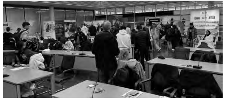
Im Kreistagssaal des Landratsamts kommen Jugendliche mit verschiedenen Ausbildungsbetrieben ins Gespräch.

Man werde nun gemeinsam mit den Kooperationspartnern ein Fazit zur Veranstaltung ziehen. „Das Feedback aller Teilnehmenden motiviert aber für eine Wiederholung des Azubi-Speed-Datings“, heißt es in der Mitteilung des Landratsamts.