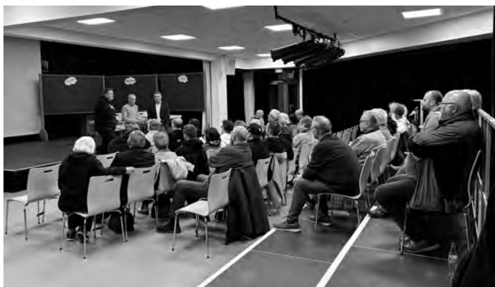
Konstruktive Gespräche zum Thema „Beteiligung der Kirche bei den VSÖ“ führten Vorstandschaft, Vertreter der katholischen Kirche und rund 40 Vereinsmitglieder.

Wir waren äußerst erfreut darüber, dass etwa 40 Mitglieder der Einladung gefolgt sind. Es wurden äußerst konstruktive Gespräche und Diskussionen geführt, wobei zahlreiche Bedenken erfolgreich ausgeräumt oder zumindest ein besseres Verständnis füreinander geschaffen werden konnte. Insgesamt betrachtet war die Veranstaltung sehr erfolgreich.