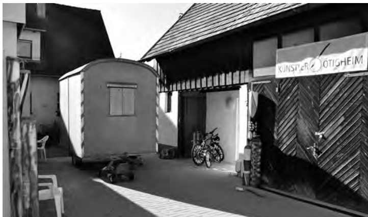
Der Bauwagen vor der Kunstscheune wartet noch auf seine Bemalung.