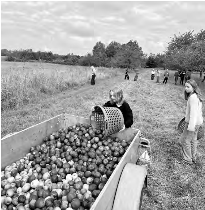
Die Klasse 6d bricht den Schulrekord im Äpfelerten.

Jetzt geht es in den Verkauf. Die 3-Liter-Saftboxen können nun bei der Klasse, den Lehrern und bei Schulveranstaltungen erstanden werden. Der Gewinn fließt direkt in das anstehende Landschulheim.