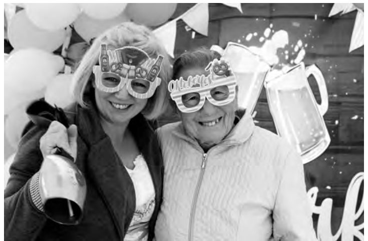
Spaß für alle - die Fotobox!

Oktoberfestmusik eingehetzt, die Spanferkel waren köstlich, der Brezelsteckenumzug bestens besucht, Hau den Lukas gar nicht so einfach und das Wetter hat auch noch mitgespielt. Das große Oktoberfest der Curatio war ein voller Erfolg! Das Wichtigste bei der ganzen Sache: Den Hausgästen hat es gefallen. Da hat der ein oder andere Hausgast doch tatsächlich noch bis in die Abendstunden hinein das Tanzbein geschwungen. Und auch einige Mitarbeiter waren noch bis spät nachts da, um die Spanferkel-Combo zu feiern. So wollten wir das! Ob der Wahnsinns-Auftritt des Musikvereins das Highlight war oder der gut besuchte Brezelsteckenumzug, bei dem jedes Kind einen bunten selbst verzierten Brezelstecken mitgebracht hatte, sei dahin gestellt. Beides war unabdingbar für das schöne Fest. Auch die Fotobox wurde von allen genutzt und bietet so manch lustigen Schnappschuss. Die gab es letztes Jahr noch nicht, genau wie das Maßkrugschieben, das dieses Jahr das Dosenwerfen, Hau den Lukas und das Wettmelken ergänzte. Was wir wohl nächstes Jahr obendrauf setzen?