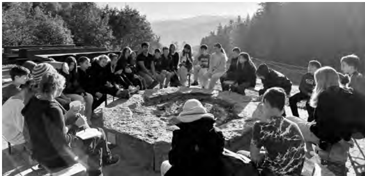
Gemeinschaftserlebnis mit Panoramablick

Wenn Kinder mit freudestrahlenden Gesichtern und leichten Anzeichen von Übermüdung in die Autos der Eltern steigen, dann ist das ein eindeutiges Zeichen für ein gelungenes Landschulheim.