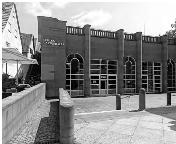
Die Schlossgartenhalle in Ettlingen: Vom 18. bis 20. Oktober stellen dort KKÖ-Mitglieder im Rahmen der Schau „Best of Art Ettlingen and Friends“ aus.

Auch ein kleines musikalisches Rahmenprogramm wird bei dieser Ausstellung geboten. So wird am Freitag, 18. Oktober, zur Vernissage um 18 Uhr die Ettlinger Jazzband „PlayJazz“ die Besucher unterhalten, und am Sonntag wird zur Matinée um 11 Uhr die Weingartner Band „Hot Club de Baugebiet“ aufspielen. Am 19. und 20. Oktober ist die Ausstellung bei freiem Eintritt jeweils von