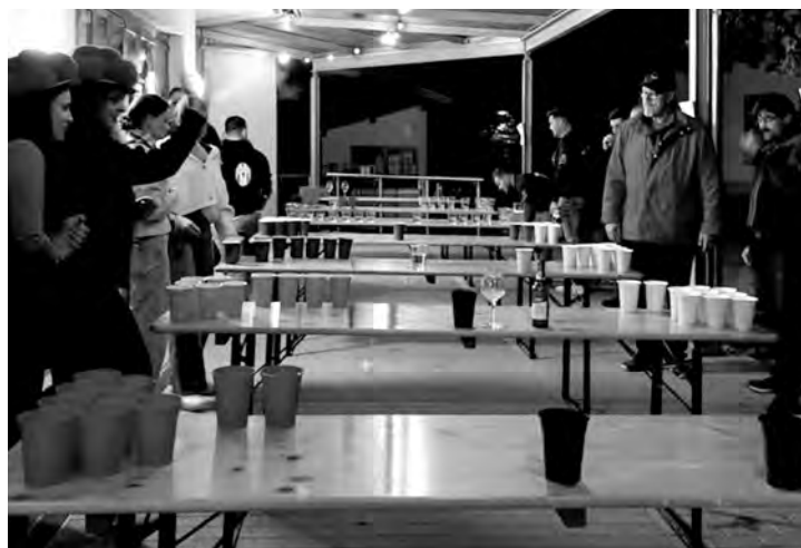
Gute Stimmung beim Bierpongturnier

Nach packenden Duellen in der Vorrunde ging es in die K.O.-Runde über, wo die Spannung weiter stieg. Das große Finale war der Höhepunkt des Abends: Mit viel Einsatz und Spielfreude sicherten sich die „Hopfenhelden“ den ersten Platz.