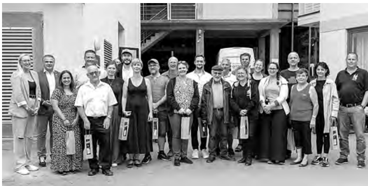
Die VSÖ bedankten sich bei den Akteuren des Theatersommers 2024.

Auch wenn „Don Camillo und Peppone“, „The Blues Brothers“ und „Der Zauberer von Oz“ nun für diese Saison abgespielt sind, ist die Saison auf dem Tellplatz noch nicht vorbei: Bis zum 28. August darf man sich noch auf Konzerte von u. a. Giovanni Zarella, Beatrice Egli, Tim Benzko und Alexander Klaws freuen.