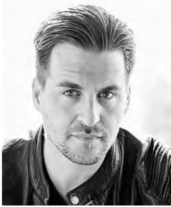
Alexander Klaws präsentiert in Ötigheim Hits aus Pop, Musical und Film.

Alexander Klaws, DSDS-Gewinner von 2003, seither sowohl als Popkünstler als auch als Musicaldarsteller erfolgreich und 2024 als Winnetou bei den Karl-May-Spielen in Bad Segeberg aktiv, gastiert am 27. August bei den VSÖ. Mit seiner Live-Band bringt er sein Programm „Pop meets Musical & Movie Hits“ nach Ötigheim.