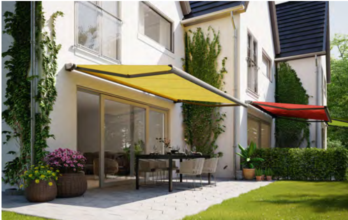
Die Markise hat eine maximale Breite von 400 cm und eine maximale Ausfalltiefe von 200 cm.

über 200 Tuchdessins zur Auswahl. Uni oder gemustert? Neutraler Non-Colour-Ton oder bunter Farbmix? Die Auswahl ist groß – auch bei kleinen Markisen. Eine Vollkassettenmarkise hat eine maximale Breite von 400 cm und eine maximale Ausfalltiefe von 200 cm. Sie lässt sich manuell per Handkurbel oder elektrisch per Motor steuern und sogar ins SmartHome integrieren.