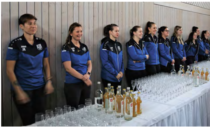
Damenmannschaft des FVÖ bewirte im Anschluss die Gäste