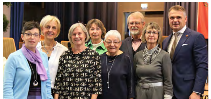
Ehrung der Helfer des „Etjer Frühstücks“