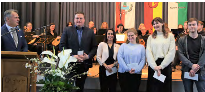
Ehrung für Initiatoren der Teilnahme „Geilstes Dorf der Welt“