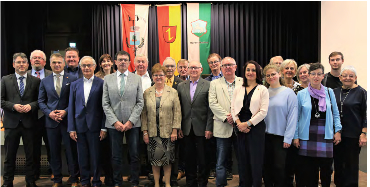
Alle Geehrten des diesjährigen Neujahrsempfangs