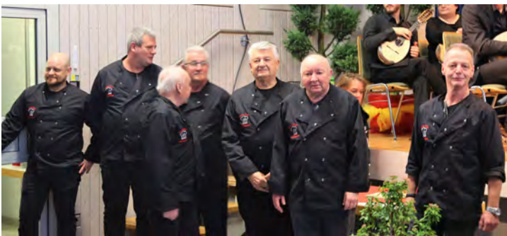
DRK-Kochclub zaubert zahlreiche Köstlichkeiten