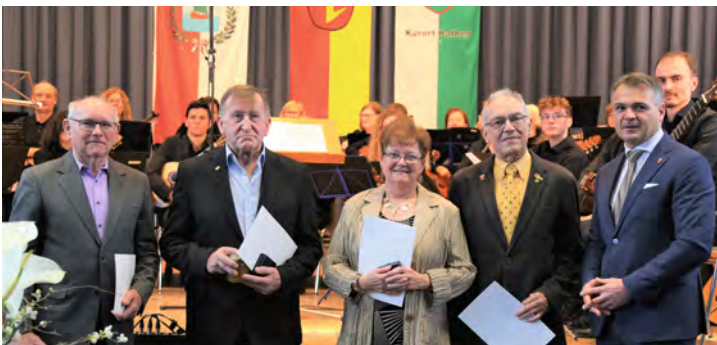
Verdienstmedaille der Gemeinde an das Team der Neuerrichtung der Marien-Grotte auf dem Friedhof