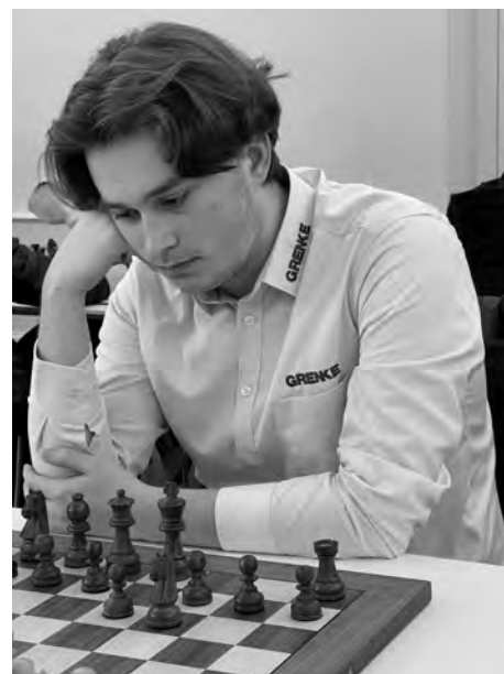
Die Nummer 12 der Weltrangliste: Vincent Keymer

Zuschauer sind natürlich wieder herzlich willkommen, allerdings muss beachtet werden, dass im Turniersaal absolute Ruhe erwünscht ist. Mobiltelefone müssen zumindest auf lautlos gestellt sein und sollten möglich nicht aus der Tasche geholt wer-