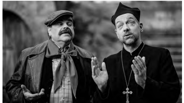
Die Komödie „Don Camillo und Peppone“ feiert am 8. Juni 2024 Premiere.

Ein vielseitiges Gastspielprogramm ergänzt auch 2024 die Eigenproduktionen des Theatervereins. Zu Gast sind neben internationalen Chören beim internationalen Chorfestival am 1. Juni und dem SAP-Sinfonieorchester am 21. Juni im August Kultstar und Musiklegende Matthias Reim (21.08.), die Sweet Soul Music Revue (22.08.), Schlagerqueen Beatrice Egli (23.08.), Singer-Songwriter Tim Bendzko (24.08.), Alexander Klaws (27.08.) und Giovanni Zarrella (28.08.).