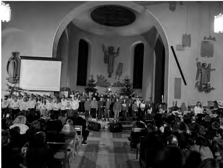
Volle Bühne und volles Haus. So soll es sein.

Vielen Dank an alle Besucher, die unser Adventskonzert wieder einmal zum vollen Erfolg machten!